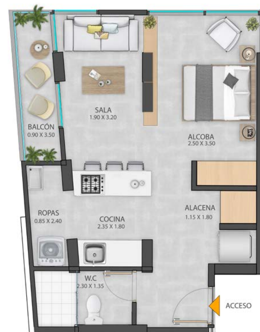
APTO TIPO 2 43,80 M 2