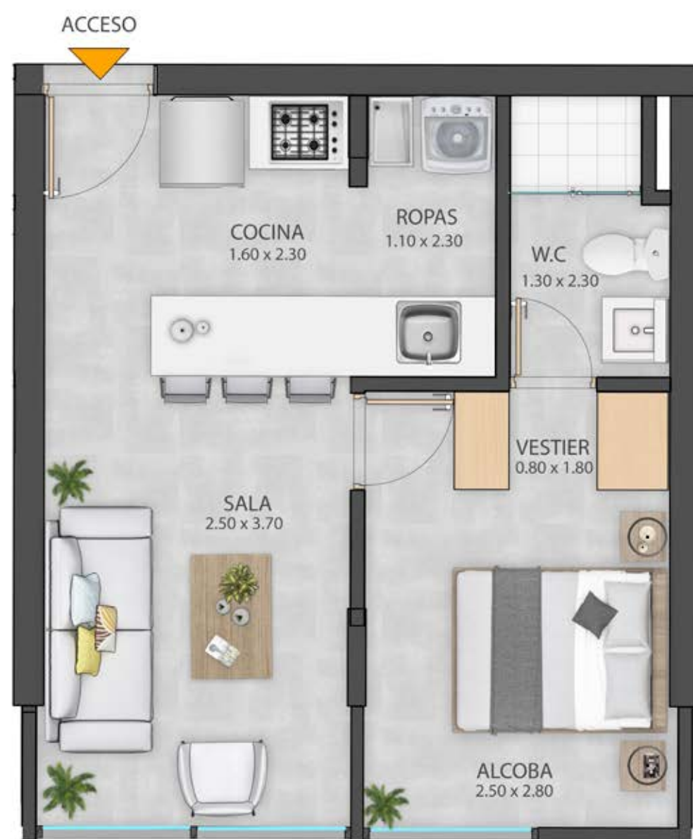
APTO TIPO 1 34,5 M 2