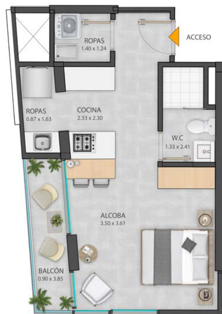
APTO TIPO 3 37,60 M 2